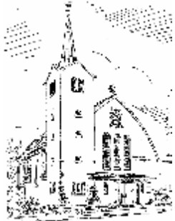
Pfarrkirche St. Marien