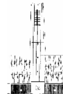
Ferialkirche St. Hedwig

„Wo sind unsere Wurzeln?“, „Was trägt uns?“, „Was blüht uns?“, „Was ernten wir?“ Mit diesen Fragen beschäftigen wir uns in dieser Adventszeit in besonderer Weise. Die Adventsgestaltung in der Marienkirche bietet für unser Überlegen einen sichtbaren Rahmen. Jeweils an den Adventssonntagen ist eine dieser Fragen in Mittelpunkt unserer Predigtreihe.