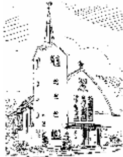
Pfarrkirche St. Marien