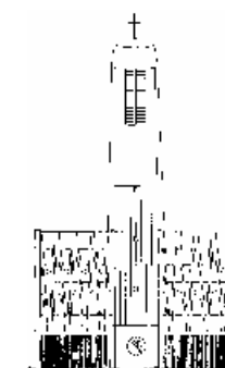
Filiationkirche St. Hedwig

vom 5. Sonntag der Osterzeit bis zum 7. Sonntag der Osterzeit