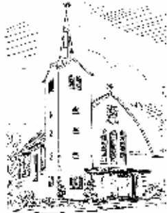
Pfarrkirche St. Marien