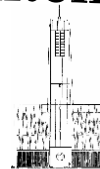
Ferialkirche St. Hedwig

vom 23. Sonntag im Jahreskreis bis zum 25. Sonntag im Jahreskreis