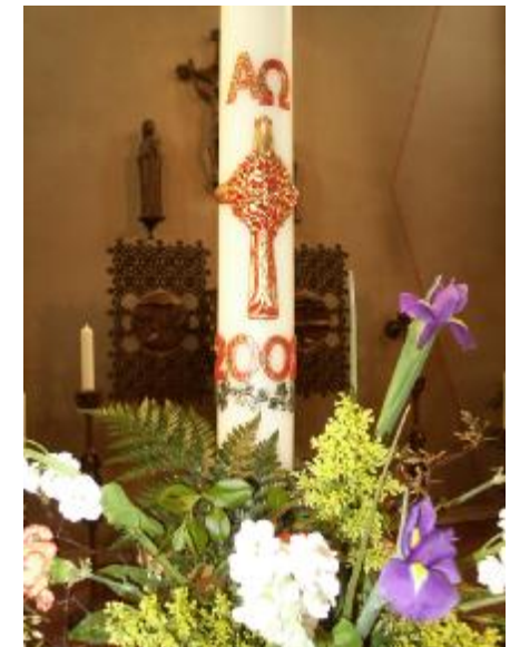
(Ulrike Nagel, Gemeindereferentin)