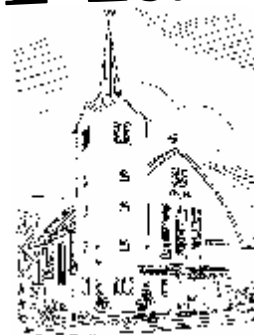
Pfarrkirche St. Marien