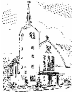
Pfarrkirche St. Marien