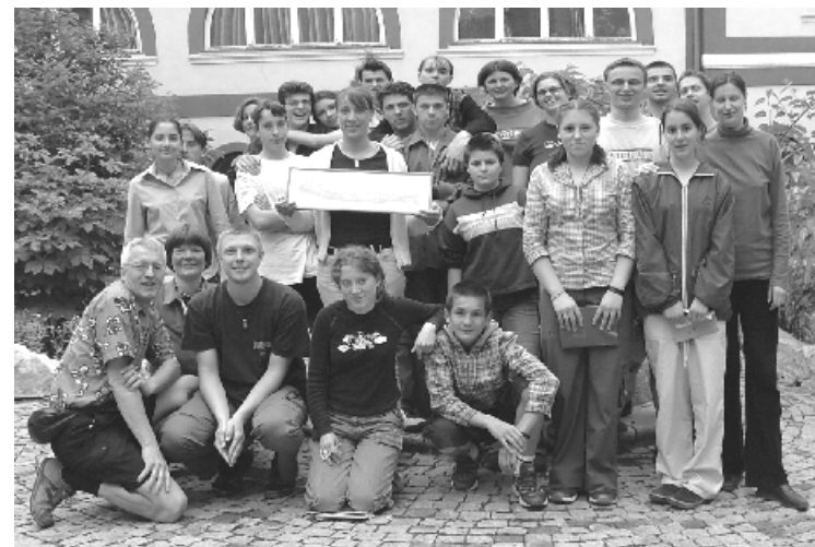
Das Foto zeigt die Exkursionsgruppe des BDJ-KV Unna mit einem Teil der Jugendlichen, die nach Unna kommen werden.

Wenn Sie/Du mehr erfahren möchtest zu dieser Begegnung, bitten wir, am Dienstag, den 22.06. um 20 Uhr ins Alois-Gemmeke-Haus, Holzwickede zu kommen oder am Donnerstag, 24. 06. 20 Uhr ins Pfarrzentrum St. Katharina, Unna. Dort stellen wir das Projekt genauer vor und beantworten gern alle Fragen, die sich ergeben.