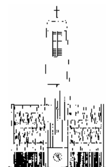
Ferialkirche St. Hedwig

vom 4. Fastensonntag bis zum Palmsonntag