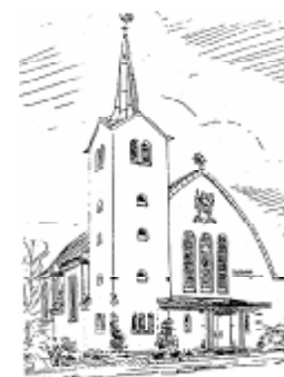
Pfarrkirche St. Marien